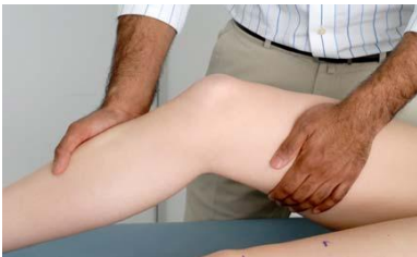
6.7 Сурет:Бүйір коллатералдық байламдарын тексеру