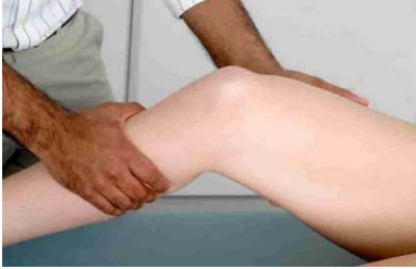
6.6 Сурет:Аралық коллатералдық байламдарын тексеру