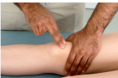
6.2 Сурет:Тізе тобығын соғып көрсетілуі