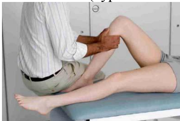
6.4 Сурет: Жамбас санының алдыңғы жағына текерудің көрсетілуі