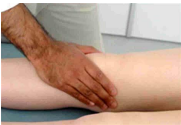
6.1 Сурет: Ісіну/уқалау/сұйықтықты жылжытып тексерілуінің көрсетілуі