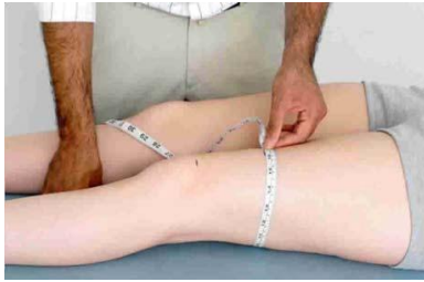
6.3 Сурет: Жамбас санының төрт басты бұлшық еттің арықтауын өлшеу