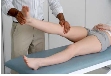
6.9 Сурет: Pivotshifttest көрсетілуі