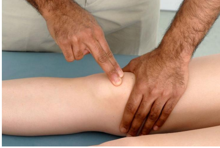
شكل ٢.٦: توضيح اختبار نقر الرضفة.

(ج) قم بقياس محيط الفخذ للتحقق من ضمور العضلة رباعية الرؤوس ( من نقطة ثابتة فوق حديبة الظنوب أو فوق القطب العلوي للرضفة بمسافة ١٠ سم ).