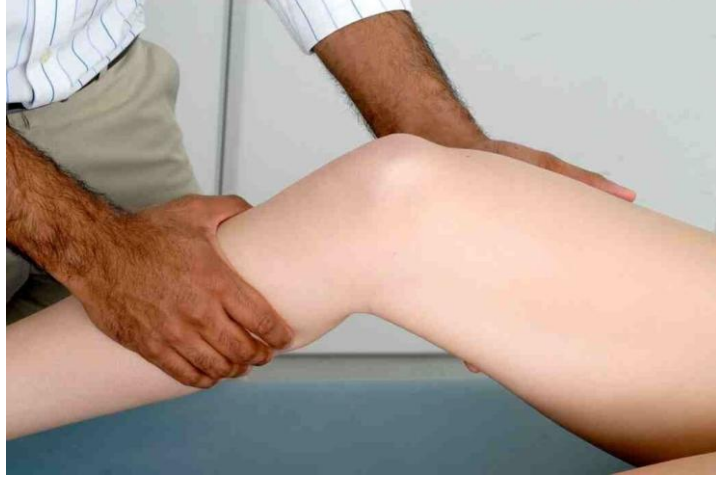
شكل ٦.٦: اختبار الرباط الجانبي الإنسي.

يثني المريض ركبته بمقدار ٣٠ درجة و اضغط على خط المفصل الانسي و الجانبي. تحقق من رخاوة الأربطة.