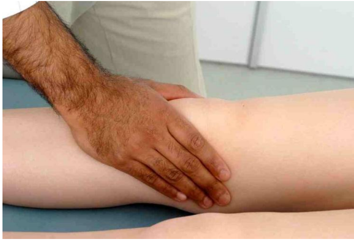
شكل ٦. ١: توضيح اختبار الانتفاخ و نزح السوائل.