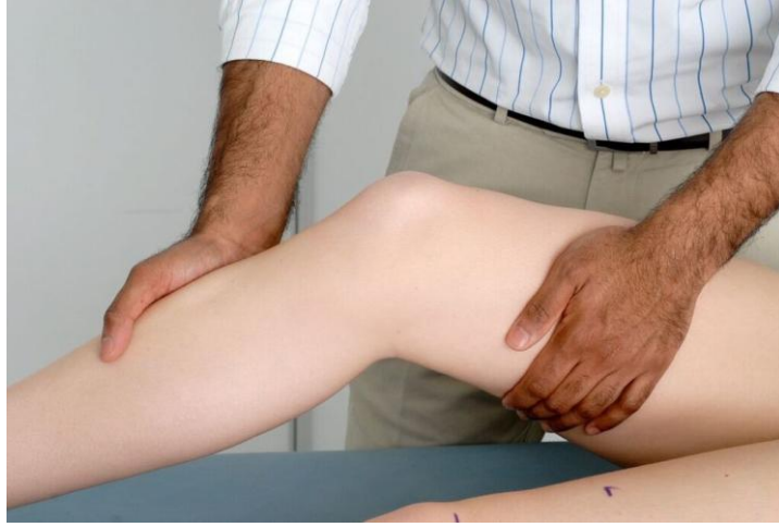
شكل ٦.٧: اختبار جانب الرباط الجانبي.