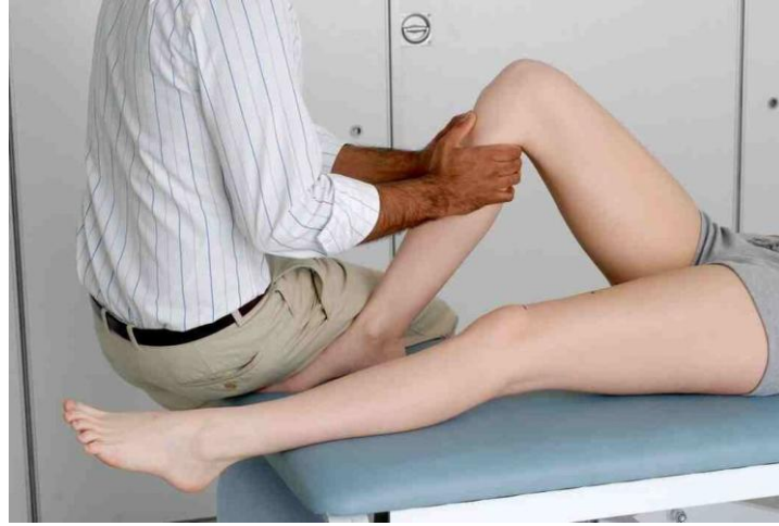
شكل ٦. ٤: توضيح اختبار الدرج الأمامي.

اطلب المريض أن يثني ركبتيه و اجلس على قدميه ثم قم بتحريك ساقه للأمام والخلف لتتحقق من الحركة الزائدة و الترهل الخلفي. يكشف هذا الاختبار عن مدى ثبات الأربطة الأمامية والخلفية.