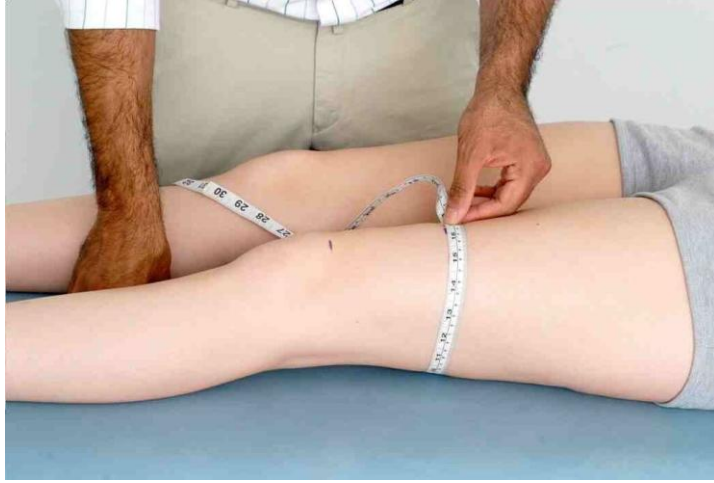
شكل ٣.٦: قياس محيط الفخذ للتحقق من ضمور العضلة رباعية الرؤوس.

(ج) قم بقياس محيط الفخذ للتحقق من ضمور العضلة رباعية الرؤوس ( من نقطة ثابتة فوق حديبة الظنوب أو فوق القطب العلوي للرضفة بمسافة ١٠ سم ).