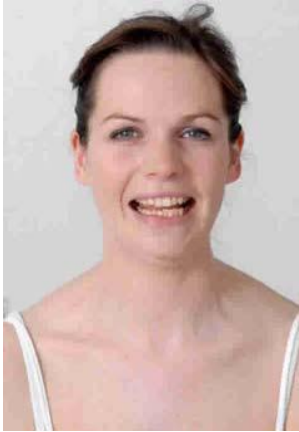
8.5 Сурет: Жақ асты шетінің тарамдарын тексеру: «Тістеріңізді көрсетіңіз»