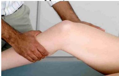
6.6 Сурет:Аралық коллатералдық байламдарын тексеру