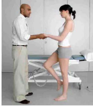
5.1 Сурет:Тренделенбург сынағының көрсетілуі

Егер қарсы жақта жамбас саны жоғары қисайса (қалыпты жағдай), сынақ қорытындысы кемшілік жоқ екеніндігін білдіреді