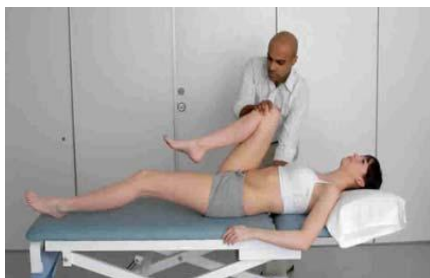
5.2 Сурет:Бүгілу деформациясын анықтауда Томас сынағының көрсетілуі

Томас сынақтамасы (Thomastest) – бүгілу деформациясын қараңыз. Қолыңызды науқастың арқасына қойып, жамбас санын толықтай бүгуге сұраңыз және бел лардозының бітелуіне бақылаңыз. Бел лардозының бітелуін тексергенде, науқас жамбас санын барынша созыуы тиіс. Егер жамбас саны бүгілсе, онда Томас сынақ нәтижесінің қорытындысы кемшілік бар екеніндігін білдіреді, сонымен қатар бүгіліс шамасы өлшеніп алынуы қажет (5.2 сурет).