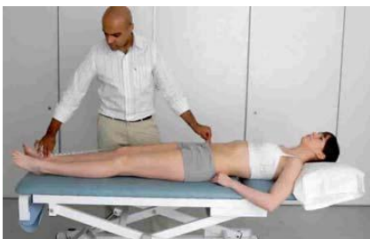
5.4 Сурет: Аяқтың ұзындығын алдыңғы жоғарғы мықын қылқаннан ішкі тобыққа дейін өлшеу