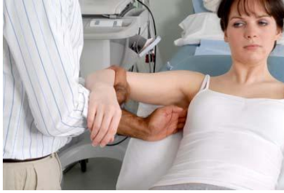
3.4 Сурет: Қолтықты пальпациялау: лимфатүйіндердің ортаңғы, артқы топтары