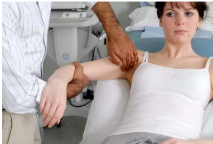
3.5 Сурет: Қолтықты пальпациялау: лимфатүйіндердің алдыңғы, бүйір топтары

Орын алмастырып, келесі жақтағы омырау мен қолтықты тексеріңіз. Егер түйін/ісік тапсаңыз, сипаттаңыз: